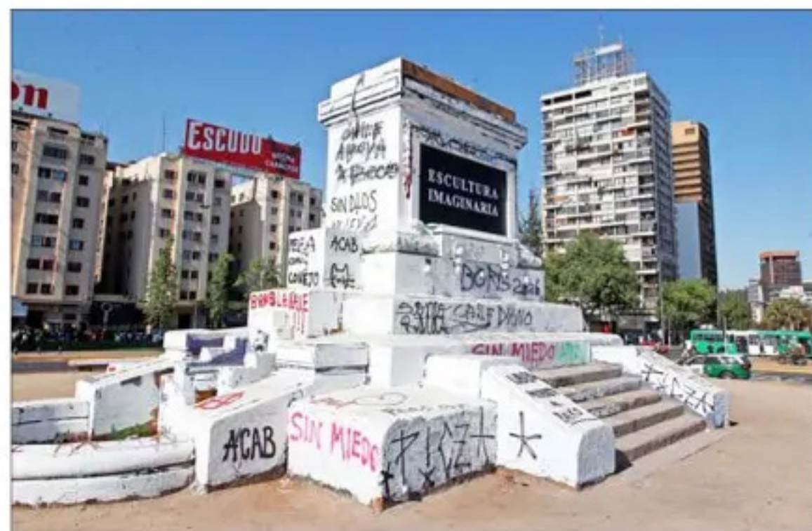
Plaza Baquedano, centro de las manifestaciones del 18 de octubre y los meses posteriores.