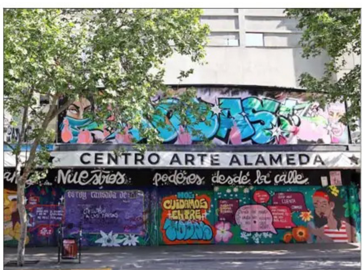
Cine Arte Alameda.

De acuerdo con los registros de la Cámara de Comercio de Santiago (CCS), a partir del 18 de octubre del 2019, han cerrado 800 comercios en la comuna de Santiago, vinculado no solo al estallido, sino que a la pandemia, al avance del comercio ambulante y a la delincuencia.